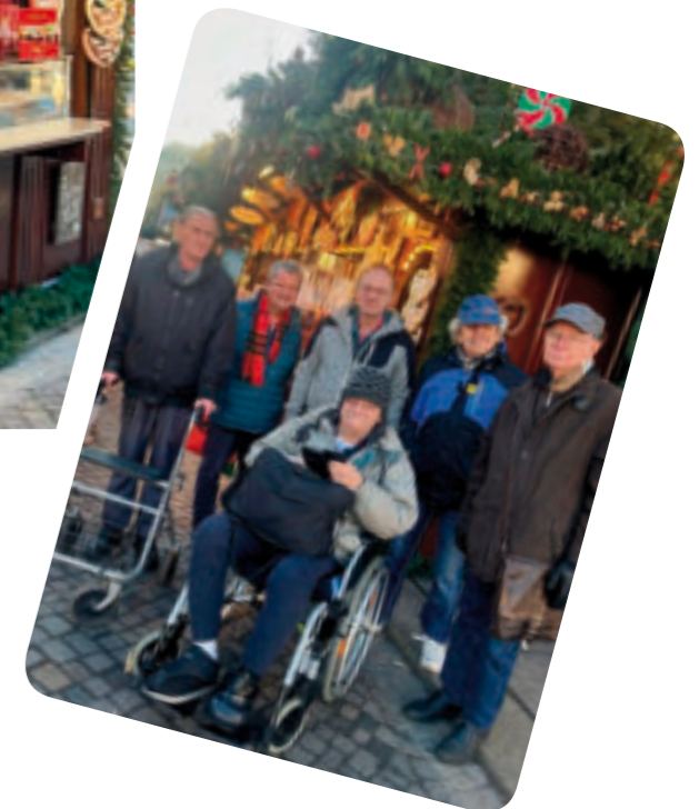
Der Striezelmarkt in Dresden ist etwas ganz besonderes mit seiner Atmosphäre, den bunten Buden und vielfältigen Angeboten. Das machte den Bewohnern sichtlich Freude.