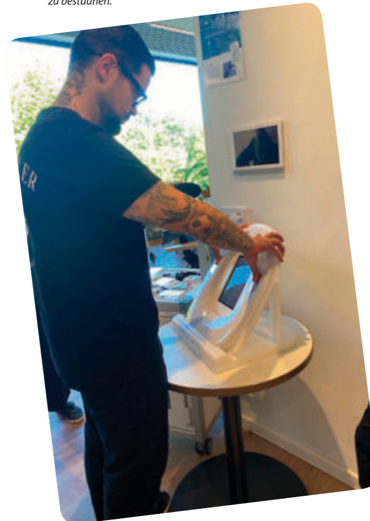
Bild unten rechts: Auch im Bad und Duschbereich gab es viele Innovationen zu bestaunen.