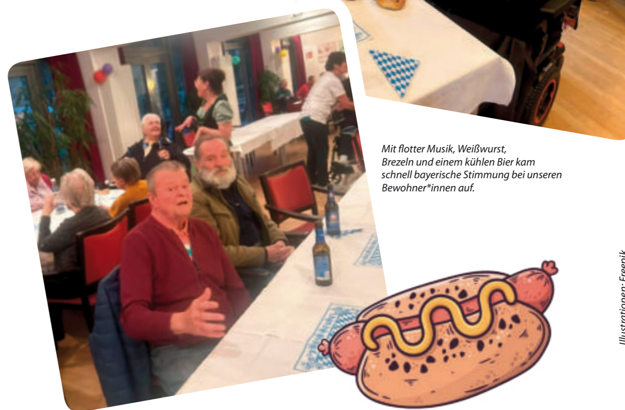
Mit flotter Musik, Weißwurst, Brezeln und einem kühlen Bier kam schnell bayerische Stimmung bei unseren Bewohner*innen auf.