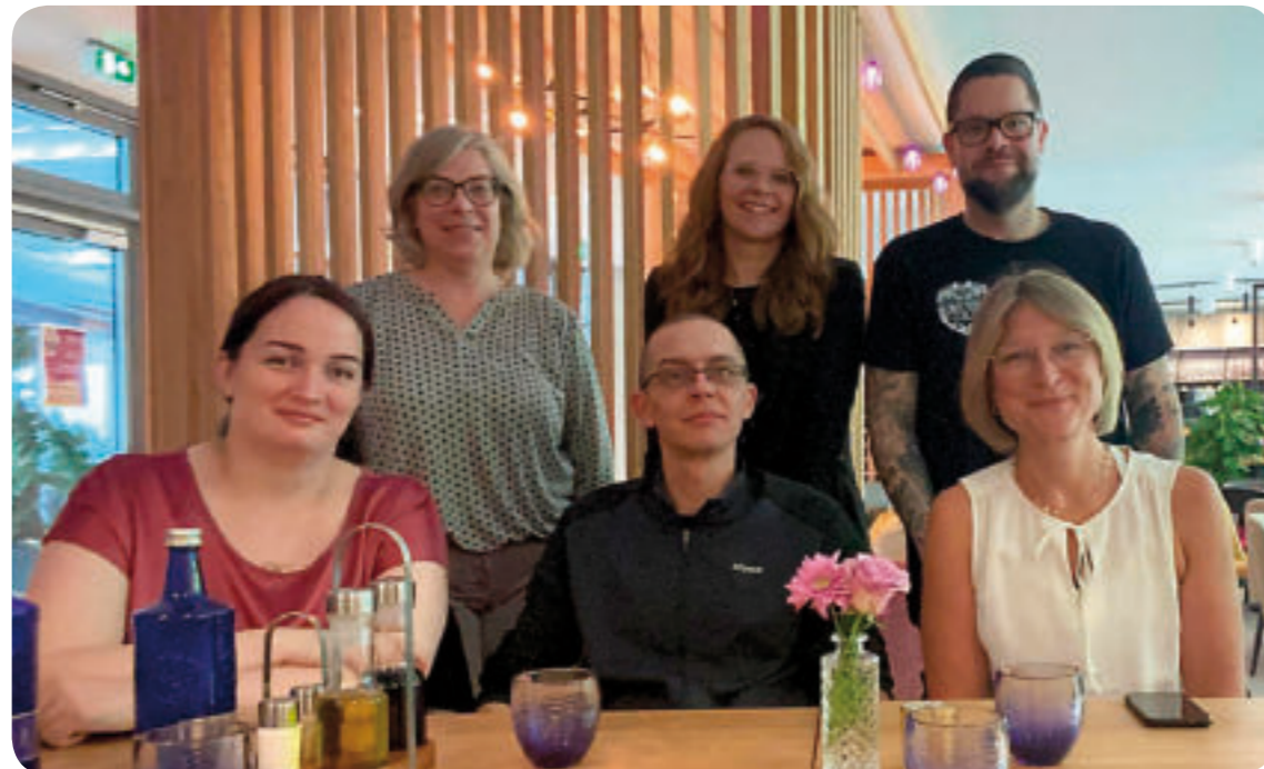
Das FSE-Team im Haus der Zukunft beim Teamtag, der spannende Einblicke in neue Technologien brachte.