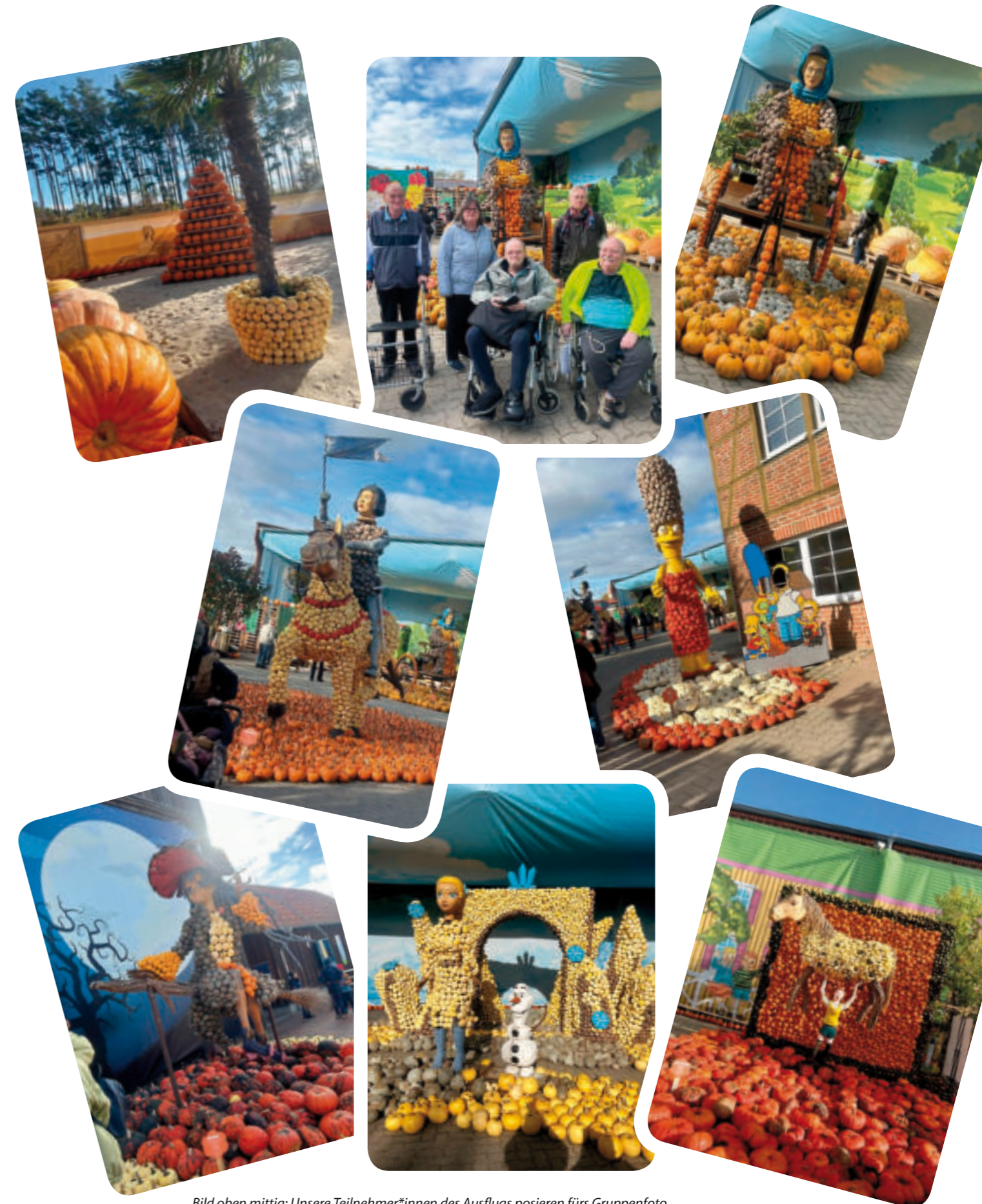
Bild oben mittig: Unsere Teilnehmer*innen des Ausflugs posieren fürs Gruppenfoto.

Fotos: Eindrücke von den vielfältigen Dekorationen und Figuren aus Kürbissen zum Thema ‚Power Frauen‘.