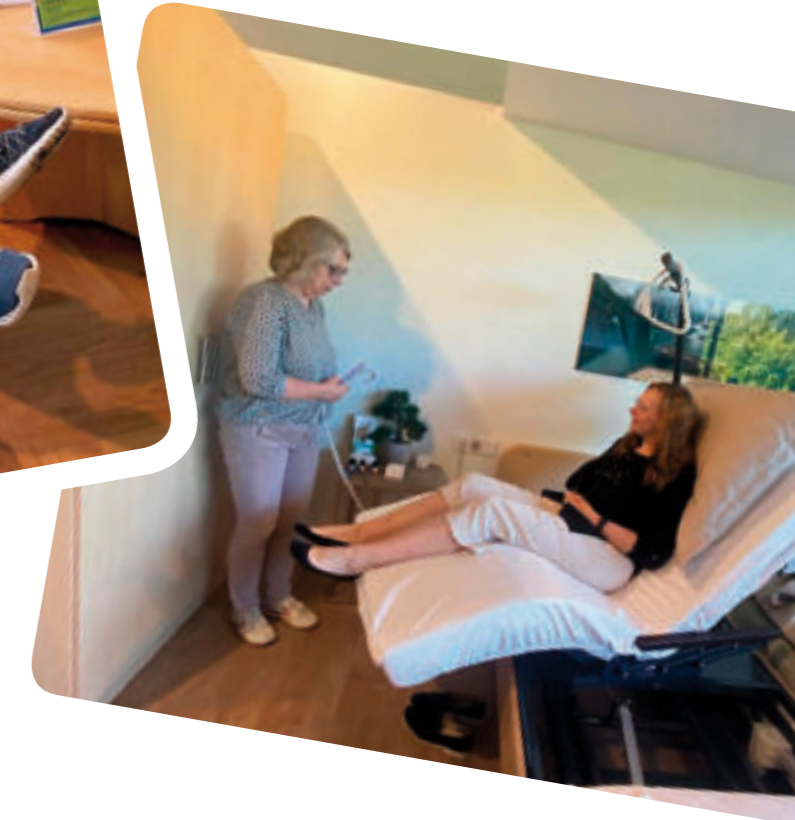
Bilder oben links und rechts: Fernbedienungen am Sessel oder im Bett gehören heute schon zur Grundausstattung eines altersgerechten, komfortablen Lebens.